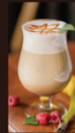
Горный шоколад «Какао бун» 390 Р (300 мл) 450 Р (400 мл) Бонгл, малина, лимон