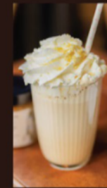
Раф «Солёная карамель» 390 Р (300 мл) 450 Р (400 мл) Сливочное молоко, карамель