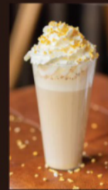
Латте «Дынный чизкейк» 390 Р (300 мл) 450 Р (400 мл) Дыня, чизкейк, меренга