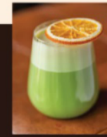
Латте «Сливочный бергамот» 390 Р (300 мл) 450 Р (400 мл) Бергамот, сливочное молоко