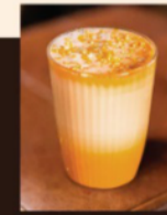
Латте «Солнышко в руках» 390 Р (300 мл) 450 Р (400 мл) Сироп, корица