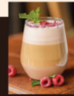
Капучино «Малина-холодок» 390 Р (300 мл) 450 Р (400 мл) Малина, лимон

Добавить в напиток скорпи по вкусу - это бесплатно.